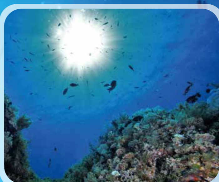
Fondali marini (Isole Tremiti).