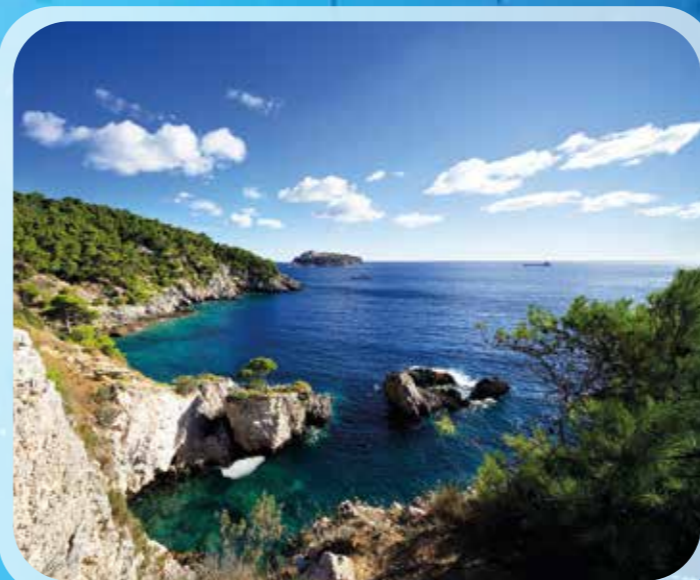
Pineta dell'Isola di San Domino (Isole Tremiti).