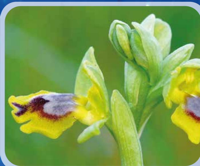
Ophrys lutea subsp. sicula (Mattinata).