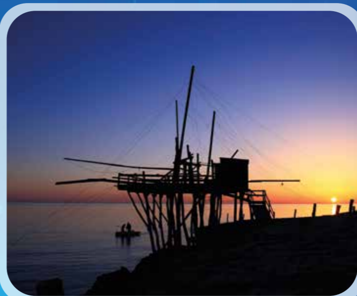
Trabucco di San Lorenzo (Vieste).