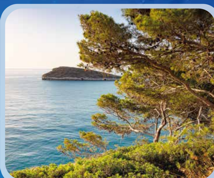
Baia dei Campi (Vieste).