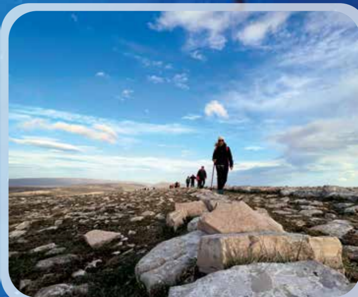
Escursione a Montecalvo (San Giovanni Rotondo).