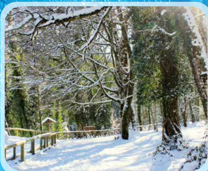
Sentiero Murgia. Foresta Umbra (patrimonio UNESCO) imbiancata di neve, Monte Sant'Angelo.