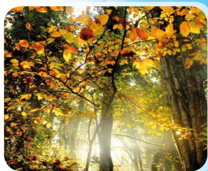
Coppia Croce. Foresta Umbra in autunno (Monte Sant'Angelo).