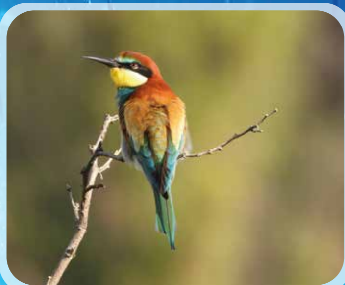
Gruccione Merops apiaster, Lago Salso (Manfredonia).