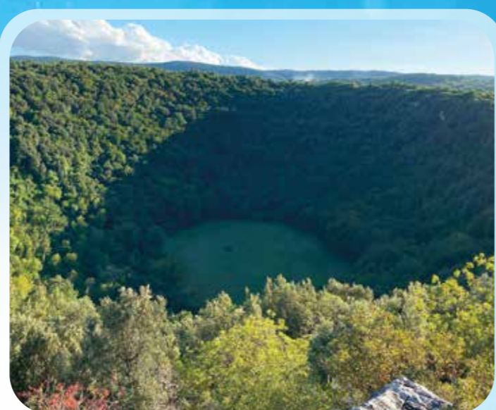
Dolina Pozzatina (San Nicandro Garganico).