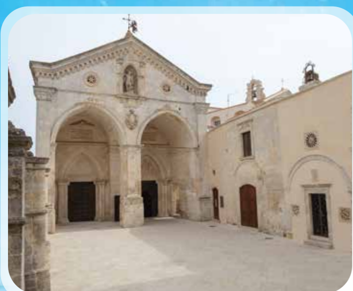
Monte Sant'Angelo, Santuario di San Michele Arcangelo (patrimonio UNESCO).